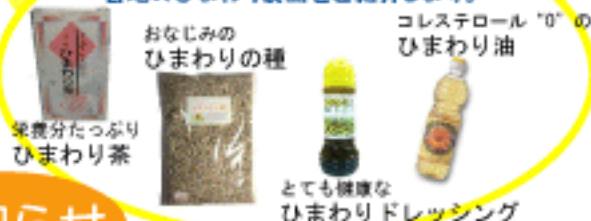
栄養分たっぷり ひまわり茶