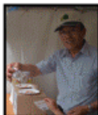
あっさりした 『なのはな油』が 人気者!!

とよかも自慢の商品満載の「とよかも市場」。 なたね油を販売、ひまわりの種を配布 しました。