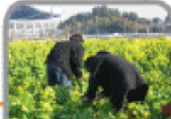
ボランティアのみなさん、菜の花摘みありがとうございました。