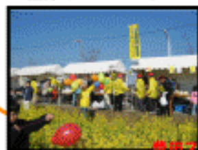
豊田スタジアム裏に約1000㎡、70万本の菜の花が開花しました!

最近ではおなじみのBDFで走行するトラクター、菜の花摘み、菜の花料理をみなさんに楽しんでいただきました。 ボランティアのみなさん、ご協力ありがとうございました。