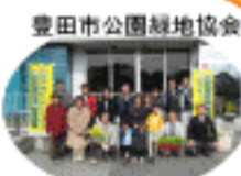
豊田市公園緑地協会