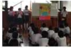
みんなの前での発表です

各クラスで、テーマを持ち子ども達が、調べた内容を発表してくれました。菜の花の事やBDFなど、今まで子ども達と学習してきた内容です。これをきっかけに、プロジェクトの掲げる循環型社会や地産地消に興味を持ってくれる事を期待します。また、これから個人で環境に関するテーマを決め学習していくそうです。どんな内容になるのか楽しみです。