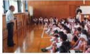
真剣に話を聞いてくれています