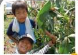
こんな感じに実ったよ

今年は、たくさんのとうもろこしが実り、十分に味わえるほどの収穫量でしたが、えだまめは実入りが少なく、残念な結果となってしまいました。植物と言えど生きているのですね。なかなか思うようになりません。また、それが一つの楽しみとし、来年は、たくさん実ってくれるようお願いを込め、第1回収穫祭を終えました。お世話になった方々、有難うございました。