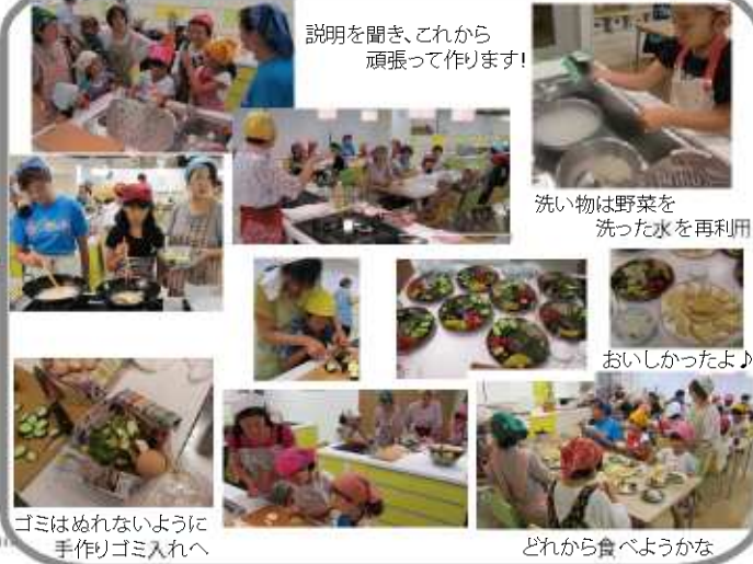
説明を聞き、これから頑張ってください!

初めての試みで、今年は子どもの宿題にもなるおいしく楽しくみんなでお勉強できるように、エコクッキングを開催しました。多少の不便があったものの参加者の皆さんにもお手伝い頂き無事に何事もなく過ごすことができました。