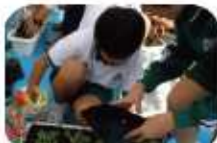
簡単に思えたのに、やってみると土の盛り方って難しい・・・

今回は、以前、種を撒き育てた菜の花の植替えを行いました。たくさんのお花が咲きますように丁寧に植替えました。