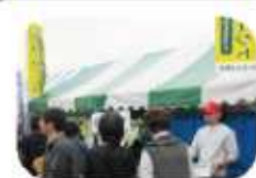
みよし産業フェスタ

こちらも例年並の人出となり、活気溢れるものとなりました。豊田・加茂のなのはな油の販売や、石けん・なのはなドーナツを販売しました。