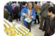
油の試飲を是非、してみてください

名古屋にある丸栄で行われましたあいち農林水産フェアでは、6日間の予定入場者数の3万人をはるかに超えた3万7千人の入場者数があり大変賑やかなフェアとなりました。その中でも、当プロジェクトでは3日間参加し、油の販売を行いました。