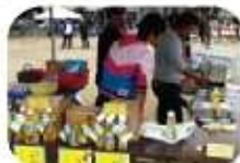
梅坪台ふれあいまつり

当日は、時折小雨が降る天気でしたが、暖かった為、たくさんの方がいらして下さいました。出店場所は舞台が近かったので子供達の演奏や、踊る姿も見られ楽しく過ごす事が出来ました。当プロジェクトでは、豊田・加茂のなのはな油や、石けんなのはなドーナツを販売しました。