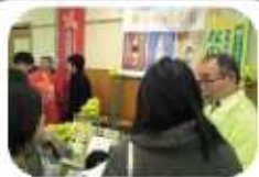
話を聞いて下さっています。

アイリス愛知 2階「コスモス」及び「サフラン」にて行われました、このビジネスフェアは、生産者や食品製造業者など、幅広い分野の事業者が、愛知県産の農林水産物やその加工品を持ち寄って情報交換や商談を行い、新商品の開発や新たな販路の開拓に取り組むものです。