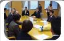
今後の予定を聞いて下さっています

表面でもお知らせしました、菜の花キャラバンを今年も行い無事終わることができました。今年も、事前の用意や当日のお手伝いでプロジェクトの会員の皆様にご協力、有難うございました。