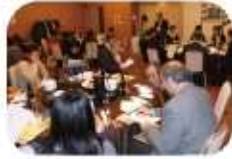
沢山の方が来て下さいました