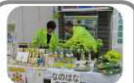
良い出会いがありますように

豊田市民文化会館で行われました。市内では米・茶・果樹・酪農・鶏肉・野菜・など、様々な農作物を地域資源として活用するきっかけ作りとなるよう企画されたものです。