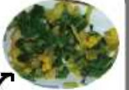
菜の花が入っています

今年も、地産地消の一環として作っている菜の花が豊田市内の小中学校の給食に登場しました。