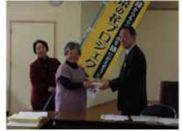
豊田加茂農林水産事務所にて