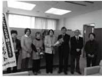
こども発達センターにて