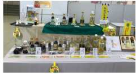
ブースの様子です