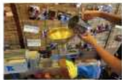
搾油体験の様子です。