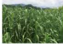
ソルゴーが生えています。