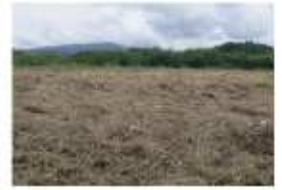
すきこみをします。 豊田市乙部町