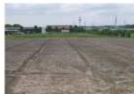
肥料散布後 みよし市打越町新池浦