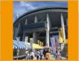
昨年度の “とよた産業フェスタ”の様子です

今月開催されます、とよた産業フェスタ2017では、新油がお披露目となります。今年も良いできとなっています。是非、お買い求め頂き感想などいただけると嬉しく思います。なお“なのはな商品”のご購入は随時、下記事務所にて取り扱っておりますので、お手数ですがお問い合わせの上、お越し下さい。お待ちしております。